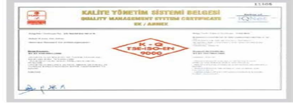
BR BERKOSAN Kalite Yönetim Sistemi Belgesi Ek