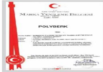
POLYBERK Marka Tescil Belgesi