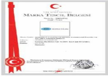
BR BERKOSAN Marka Tescil Belgesi