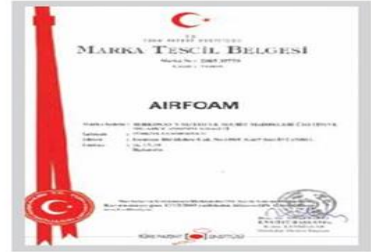
AIRFOAM Marka Tescil Belgesi