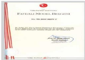
Faydalı Model II Belgesi