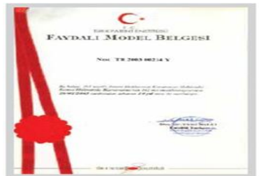
Faydalı Model III Belgesi