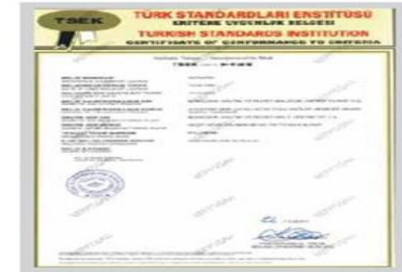
POLYBERK TSEK Belgesi