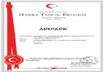
AIRPACK Marka Tescil Belgesi