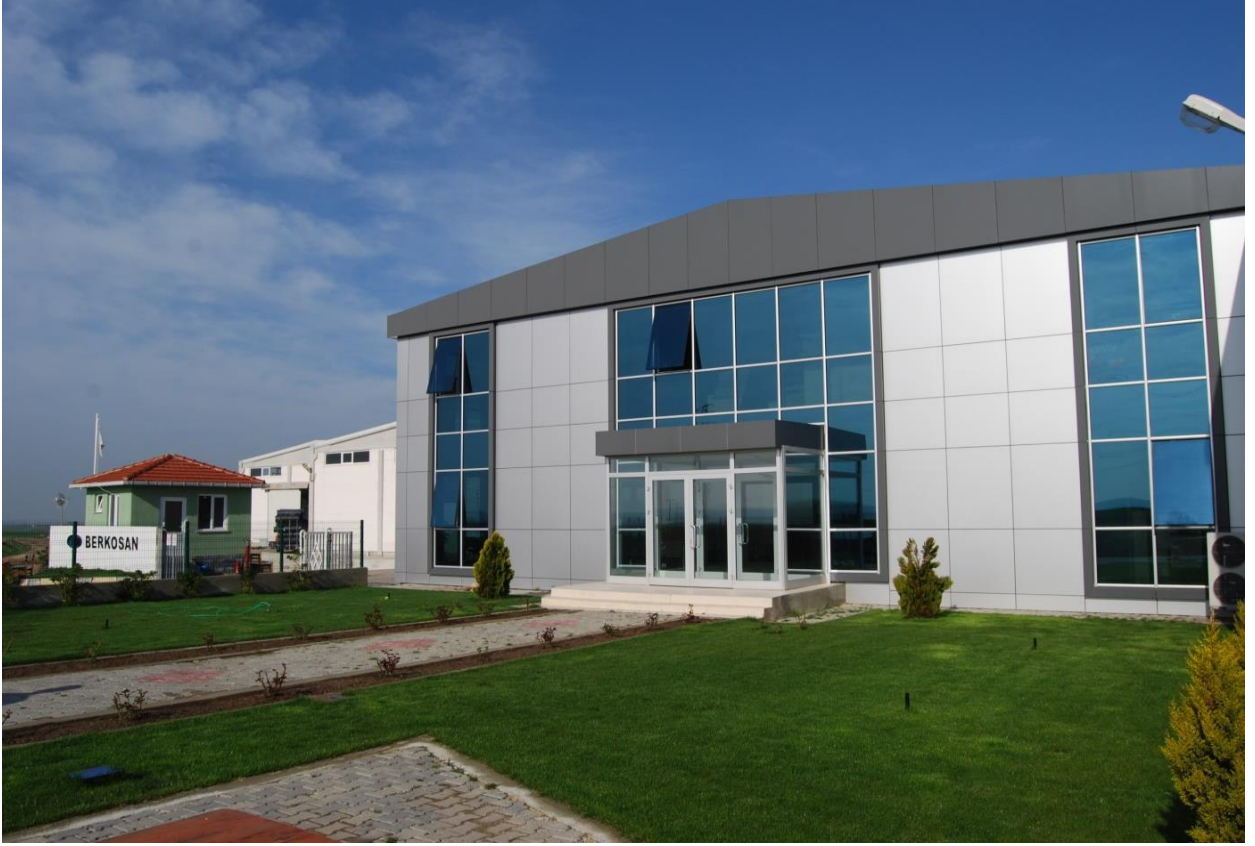
Berkosan Bozüyük Fabrika