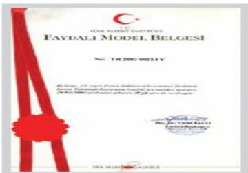
Faydalı Model I Belgesi