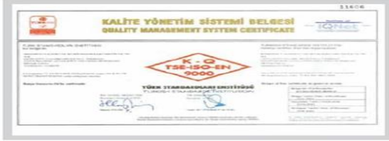
BR BERKOSAN Kalite Yönetim Sistemi Belgesi