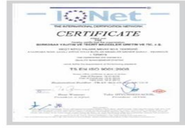
BR BERKOSAN Net Certificate