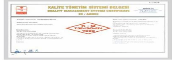
BR BERKOSAN Kalite Yönetim Sistemi Belgesi Ek