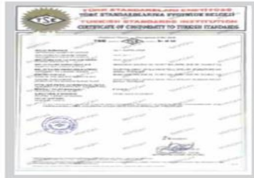
FoamEX TSE Belgesi