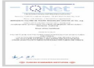
BR BERKOSAN Net Certificate