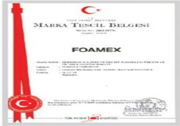
FoamEX Marka Tescil Belgesi