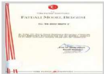
Faydalı Model II Belgesi