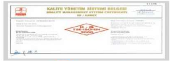
BR BERKOSAN Kalite Yönetim Sistemi Belgesi Ek