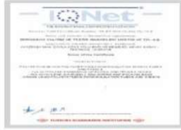
BR BERKOSAN Net Certificate