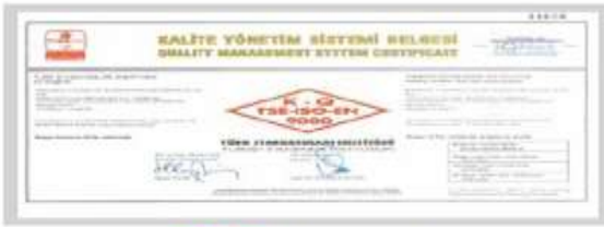
BR BERKOSAN Kalite Yönetim Sistemi Belgesi