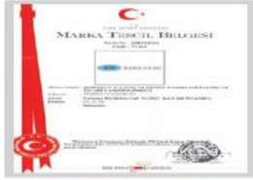
BR BERKOSAN Marka Tescil Belgesi