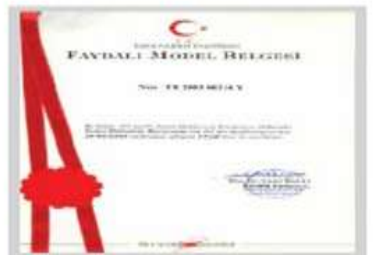
Faydalı Model III Belgesi