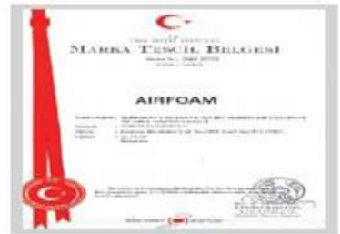
AIRFOAM Marka Tescil Belgesi