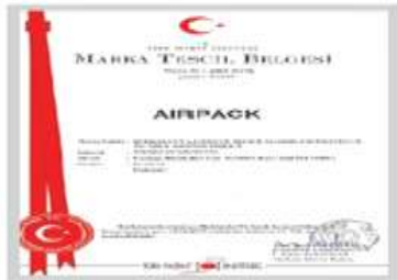
AIRPACK Marka Tescil Belgesi