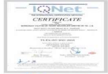
BR BERKOSAN Net Certificate