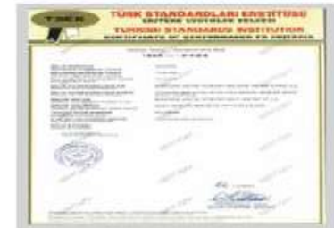
POLYBERK TSEK Belgesi