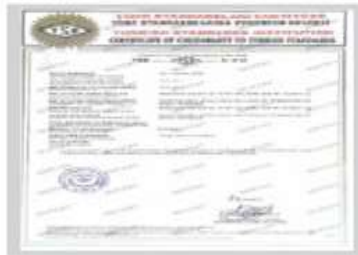
FoameX TSE Belgesi