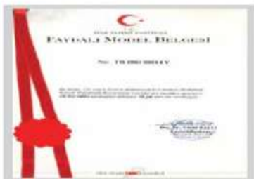
Faydalı Model I Belgesi