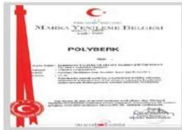
POLYBERK Marka Tescil Belgesi