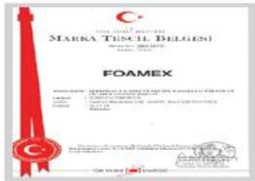
FoameX Marka Tescil Belgesi