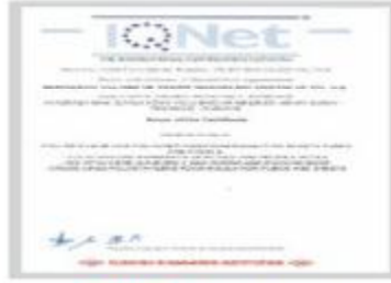
BERKOSAN Net Certificate