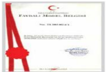
Faydalı Model III Belgesi