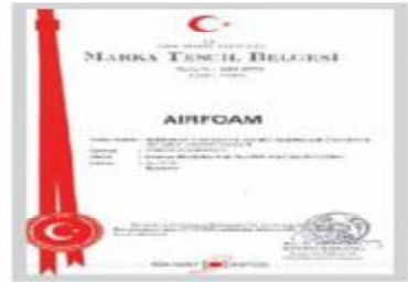
AIRFOAM Marka Tescil Belgesi