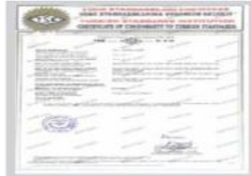
FoamEX TSE Belgesi