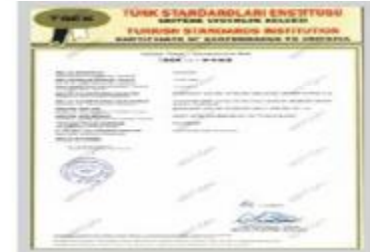
POLYBERK TSEK Belgesi