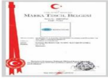
BERKOSAN Marka Tescil Belgesi