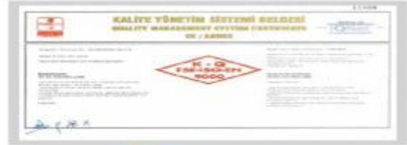
BERKOSAN Kalite Yönetim Sistemi Belgesi Ek