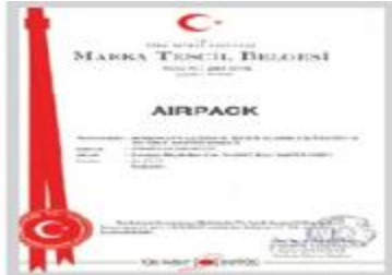
AIRPACK Marka Tescil Belgesi