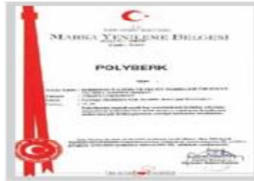
POLYBERK Marka Tescil Belgesi