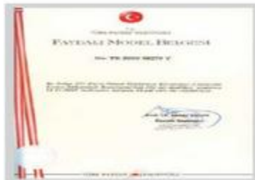
Faydalı Model II Belgesi