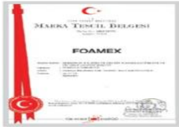
FoamEX Marka Tescil Belgesi