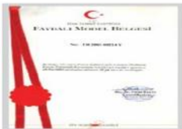
Faydalı Model I Belgesi