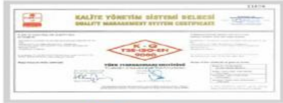
BERKOSAN Kalite Yönetim Sistemi Belgesi