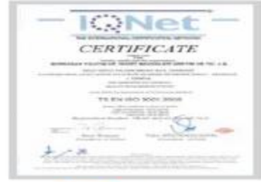
BERKOSAN Net Certificate